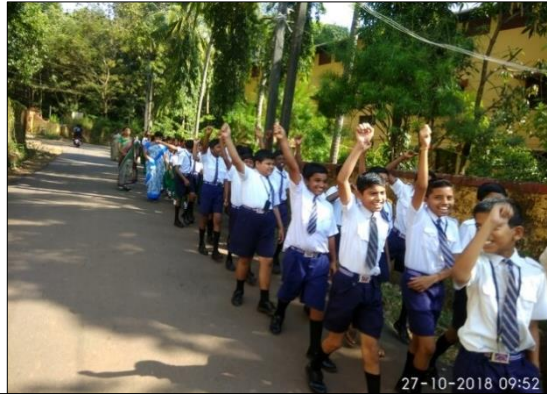
ಬಯಲು ಮುಕ್ತ ಶೌಚಾಲಯದ ಬಗ್ಗೆ ಜಾಗೃತಿಯನ್ನು ಮೂಡಿಸಲು ಇಕೋ-ಕ್ಲಬ್ ಶಾಲೆಗಳ ವಿದ್ಯಾರ್ಥಿಗಳು ಜಾಥಾವನ್ನು ಕೈಗೊಂಡರು

ಮೈಸೂರು ದಸರಾ ವಸ್ತುಪ್ರದರ್ಶನದಲ್ಲಿ ಪನಿನೀಸಂಸಂಯ ಮಳಿಗೆಯಲ್ಲಿ ಬಯಲು ಮುಕ್ತ ಶೌಚಾಲಯದ ಮಾಹಿತಿಯನ್ನು ಒಳಗೊಂಡ ಕರಪತ್ರಗಳನ್ನು ಹಂಚಲಾಯಿತು. ಮಳಿಗೆಯು ದಿನಾಂಕ 10 ಅಕ್ಟೋಬರ್ 2018 ರಿಂದ 15 ಜನವರಿಯವರೆಗೆ ಸಾರ್ವಜನಿಕರ ವೀಕ್ಷಣೆಗೆ ತೆರೆಯಲಾಗಿತ್ತು. ಇಕೋ-ಕ್ಲಬ್ ಶಾಲೆಗಳು ಕೂಡ ಬಯಲು ಮುಕ್ತ ಶೌಚಾಲಯದ ಕುರಿತು ಪ್ರಚಾರ ನೀಡಲು ವಿವಿಧ ಚಟುವಟಿಕೆಗಳನ್ನು ಆಯೋಜಿಸಿವೆ.