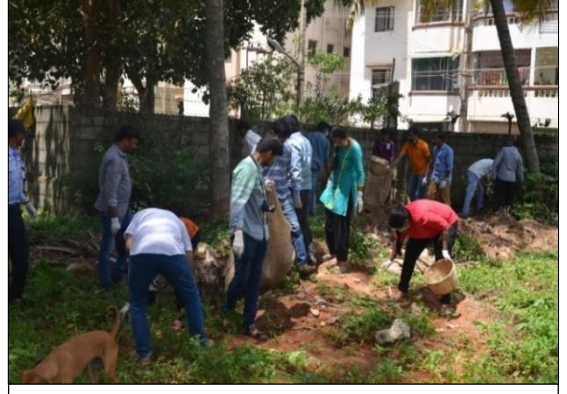
ಪನಿನೀಸಂಸಂಯಲ್ಲಿ ಸ್ವಚ್ಛತೆಯ ಕಾರ್ಯಕ್ರಮ