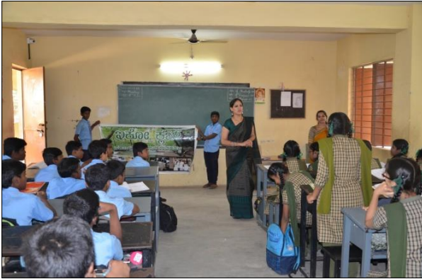
ಸರ್ಕಾರಿ ಘೌಡ ಶಾಲೆ ಉತ್ತರಹಳ್ಳಿ ಬೆಂಗಳೂರು ದಕ್ಷಿಣ ವಲಯ