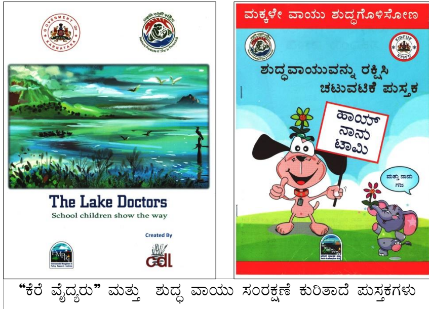
“ಕೆರೆ ವೈದ್ಯರು” ಮತ್ತು ಶುದ್ಧ ವಾಯು ಸಂರಕ್ಷಣೆ ಕುರಿತಾದ ಪುಸ್ತಕಗಳು

ಪನಿನೀಸಂಸಂಯು ಕೆರೆಗಳ ಸಂರಕ್ಷಣೆ ಬಗ್ಗೆ “ಕೆರೆ ವೈದ್ಯರು” ಮತ್ತು ಶುದ್ಧ ವಾಯು ಸಂರಕ್ಷಣೆ ಕುರಿತಾದ ಚಟುವಟಿಕೆ ಪುಸ್ತಕಗಳನ್ನು ಹೊರತಂದಿದೆ. ಈ ಪುಸ್ತಕಗಳನ್ನು ರಾಜ್ಯದ ಎಲ್ಲಾ ಇಕೋ-ಕ್ಲಬ್ ಶಾಲೆಗಳಿಗೆ ಕಳುಹಿಸಿಕೊಡಲಾಗಿದೆ. ಕೆರೆಗಳು ಹಾಗೂ ಶುದ್ಧ ವಾಯುವಿನ ಬಗ್ಗೆ ಸುಲಭವಾಗಿ ಮಕ್ಕಳಿಗೆ ಅರ್ಥವಾಗುವಂತೆ ತಿಳಿಸಿಕೊಡಲಾಗಿದೆ.