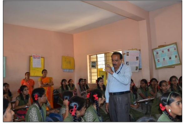
ಸರ್ಕಾರಿ ಘೌಡ ಶಾಲೆ ಅರಕೇಶ್ವರ ನಗರ ಮಂಡ್ಯ ಜಿಲ್ಲೆ