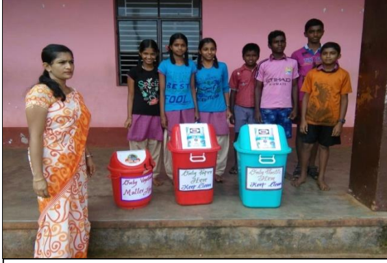
ಹೆರ್ಗಾ ವಿಟ್ಟಲ ಶೆಟ್ಟಿ ಸರ್ಕಾರಿ ಪ್ರೌಢ ಶಾಲೆ, ಕುಚೂರು ಉಡುಪಿ ಜಿಲ್ಲೆ

ಪನೀನೀಸಂಸಂ ಸಂಸ್ಥೆಯು ವಿವಿಧ ಇಲಾಖೆಗಳಿಗೆ ಹಾಗೂ ಗುಂಪುಗಳಿಗೆ ತ್ಯಾಜ್ಯ ನಿರ್ವಹಣೆಯ ತರಬೇತಿ ಕಾರ್ಯಕ್ರಮಗಳನ್ನು ಆಯೋಜಿಸಿತು. ರಾಜ್ಯದಲ್ಲಿರುವ ಇಕೋ-ಕ್ಲಬ್ ಶಾಲೆಗಳು ತ್ಯಾಜ್ಯ ನಿರ್ವಹಣೆಯಲ್ಲಿ ಸಕ್ರಿಯವಾಗಿ ತೊಡಗಿಸಿಕೊಂಡಿರುವುದಲ್ಲದೇ ಹಸಿರಸ ಹಾಗೂ ಒಣಕಸವನ್ನು ಬೇರ್ಪಡಿಸಿ ಬೇರೆ ಬೇರೆ ಬಿನ್‌ಗಳಿಗೆ ಕಸವನ್ನು ಹಾಕುತ್ತಿದ್ದಾರೆ.