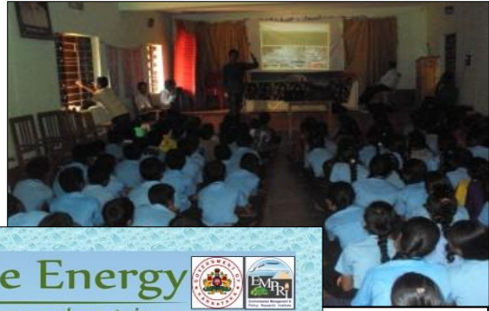
ಶಿಕ್ಷಣ ಕೋಶ, ಜಿಲ್ಲೆ