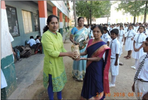
ಇಕೋ-ಕ್ಲಬ್ ಶಾಲೆಗಳಿಗೆ ಸಸ್ಯಗಳ ವಿತರಣೆ

ಇಕೋ-ಕ್ಲಬ್ ಶಾಲೆಗಳು ಮಣ್ಣಿನ ಹಣತೆಗಳು, ಹಸಿರು ದೀಪಾವಳಿ - ಸ್ವಸ್ಥ ದೀಪಾವಳಿಯ ಆಚರಣೆಯ ಪ್ರತಿಜ್ಞೆ, ಗಿಡ ನೆಡುವ ಕಾರ್ಯಕ್ರಮ, ಜಾಥಾ, ಸಾಂಸ್ಕೃತಿಕ ಕಾರ್ಯಕ್ರಮಗಳು, ಶಾಲೆಗಳಲ್ಲಿ ಹಣತೆಯನ್ನು ಬೆಳಗುವಲ್ಲಿ ಸಕ್ರಿಯವಾಗಿ ಭಾಗವಹಿಸಿದರು. ಹಸಿರು ದೀಪಾವಳಿ - ಸ್ವಸ್ಥ ದೀಪಾವಳಿಯ ಅರಿವನ್ನು ಮೂಡಿಸುವ ಕರಪತ್ರಗಳನ್ನು ಇಕೋ-ಕ್ಲಬ್ ಶಾಲಾ ವಿದ್ಯಾರ್ಥಿಗಳಿಗೆ ವಿತರಿಸಲಾಯಿತು.