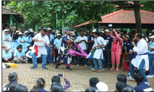
"ಪ್ಲಾಸ್ಟಿಕ್ ಮಾಲಿನ್ಯ" ಕುರಿತ ಬೀದಿ ನಾಟಕ