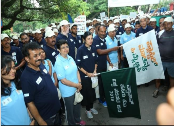
ಎನ್ವಿಥಾನ್ ಕಾರ್ಯಕ್ರಮದ ಉದ್ಘಾಟನೆ

ವಿಶ್ವ ಪರಿಸರ ದಿನಾಚರಣೆ (2018) ಅಂಗವಾಗಿ "ಪ್ಲಾಸ್ಟಿಕ್ ಮಾಲಿನ್ಯ ಹಿಮ್ಮೆಟ್ಟಿಸಿ" ಎಂಬ ಘೋಷವಾಕ್ಯದೊಂದಿಗೆ ಪರಿಸರ ನಿರ್ವಹಣೆ ಮತ್ತು ನೀತಿ ಸಂಶೋಧನಾ ಸಂಸ್ಥೆಯು ಎನ್ವಿಥಾನ್ (ಮಿನಿ-ಮ್ಯಾರಥಾನ್) 5 ಕಿಮೀ ಮತ್ತು ಸೈಕೋಥಾನ್ 10 ಕಿಮೀ ಕಾರ್ಯಕ್ರಮವನ್ನು ದಿನಾಂಕ: 3ನೇ ಜೂನ್ 2018 ರಂದು ಬೆಂಗಳೂರಿನ ಕಬ್ಬನ್ ಪಾರ್ಕ್‌ನಲ್ಲಿ ಆಯೋಜಿಸಲಾಗಿತ್ತು. ಶಾಲಾ ವಿದ್ಯಾರ್ಥಿಗಳು, ಕರ್ನಾಟಕ ಸರ್ಕಾರ ಹಾಗೂ ಕೇಂದ್ರ ಸರ್ಕಾರದ ಅಧಿಕಾರಿಗಳು ಹಾಗೂ ಸಿಬ್ಬಂದಿಗಳು, ಎನ್‌ಜಿಒಗಳು, ಭಾರತೀಯ ಸೇನೆ, ಸ್ವಯಂಸೇವಕರು ಮತ್ತು ಇತರೆ ಸಾರ್ವಜನಿಕರು ಒಳಗೊಂಡಂತೆ ಸುಮಾರು 3141 ಜನರು ಮಿನಿ-ಮ್ಯಾರಥಾನ್ ಕಾರ್ಯಕ್ರಮದಲ್ಲಿ ಭಾಗವಹಿಸಿದರು.