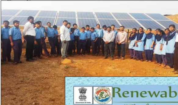
ಸರ್ಕಾರಿ ಪ್ರೌಢ ಶಾಲೆ

ಪ್ಲಾಸ್ಟಿಕ್ ನಿಷೇಧ ಅಧಿಸೂಚನೆ- 2016 ರ ಕುರಿತು ಸಾರ್ವಜನಿಕರಿಗೆ ವ್ಯಾಪಕ ಪ್ರಚಾರ ಮೂಲಕ ಅರಿವು ಮೂಡಿಸುವ ಸಲುವಾಗಿ ಮೈಸೂರು ದಸರಾ ವಸ್ತುಪ್ರದರ್ಶನದಲ್ಲಿ ಪಾಲ್ಗೊಂಡು ನಿಷೇಧಿತ ಪ್ಲಾಸ್ಟಿಕ್ ಉತ್ಪನ್ನಗಳು ಬಳಸಬಹುದಾದ ಪರಿಸರ ಸ್ನೇಹಿ ಪರ್ಯಾಯ ಉತ್ಪನ್ನಗಳ ಕುರಿತು ಭಿತ್ತಿ ಚಿತ್ರಗಳನ್ನು ಪ್ರದರ್ಶಿಸಲಾಯಿತು. ಅಲ್ಲದೆ ಇತರೆ ಪರಿಸರಾತ್ಮಕ ವಿಷಯಗಳ ಕುರಿತು ಭಿತ್ತಿ ಚಿತ್ರ ಪ್ರದರ್ಶನ ಹಾಗೂ ಕರಪತ್ರಗಳ ಹಂಚಿಕೆಯನ್ನು ಕೈಗೊಳ್ಳಲಾಯಿತು.