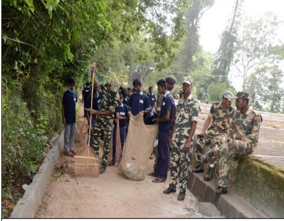
ಕೇಂದ್ರ ಮೀಸಲು ಪೋಲಿಸ್ ಪಡೆ ಸಿಬ್ಬಂದಿಯ ಜೊತೆಗೆ ಶಾಲಾ ಮಕ್ಕಳು, ಪೆನ್ನಾರ್ ನದಿ ತೀರದ ಸ್ವಚ್ಛತಾ ಕಾರ್ಯಕ್ರಮದಲ್ಲಿ ತೊಡಗಿರುವುದು.

ಪ್ಲಾಸ್ಟಿಕ್ ಫಲಕಗಳು, ಪ್ಲಾಸ್ಟಿಕ್ ಕಪ್‌ಗಳು ಮತ್ತು ಇತರೆ ತ್ಯಾಜ್ಯಗಳನ್ನು ಸಂಗ್ರಹಿಸಿ ಚಿಕ್ಕಬಳ್ಳಾಪುರ ನಗರಸಭೆಗೆ ಹಸ್ತಾಂತರಿಸಲಾಯಿತು.