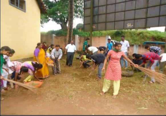
ಸರ್ಕಾರಿ ಪ್ರೌಢ ಶಾಲೆ ಶುಂಠಿಕೊಪ್ಪ ಕೊಡಗು ಜಿಲ್ಲೆ

ಪನಿನೀಸಂಸಂಯು ಪ್ಲಾಸ್ಟಿಕ್ ಮುಕ್ತ ಶಿಬಿರವನ್ನು ಆಯೋಜಿಸುವ ಸಲುವಾಗಿ ವಿವಿಧ ಚಟುವಟಿಕೆಗಳನ್ನು ಏರ್ಪಡಿಸಿ ಅವಾವುವೆಂದೆರೆ ಸ್ವಚ್ಛಗೊಳಿಸುವ ಶಿಬಿರ, ಜಾಥಾಗಳು, ತರಬೇತಿಗಳು, ಮಿನಿಮ್ಯಾರಾಥಾನ್, ನದಿ/ಕಡಲ ತೀರಗಳನ್ನು ಶುಚಿಗೊಳಿಸುವ ಚಟುವಟಿಕೆಗಳು. ಪನಿನೀಸಂಸಂಯು ಪ್ಲಾಸ್ಟಿಕ್ ನಿಷೇಧಿತ ಕರಪತ್ರಗಳು, ಪ್ಲಾಸ್ಟಿಕ್ ಮುಕ್ತ ಕರ್ನಾಟಕ ಕರಪತ್ರಗಳನ್ನು ಹಾಗೂ ಬಟ್ಟೆ ಚೀಲಗಳನ್ನು ವಿವಿಧ ಇಲಾಖೆಗಳಿಗೆ, ಗುಂಪುಗಳಿಗೆ ಮತ್ತು ಇಕೋ-ಕ್ಲಬ್ ಶಾಲೆಗಳಿಗೆ ವಿತರಿಸಿದೆ.