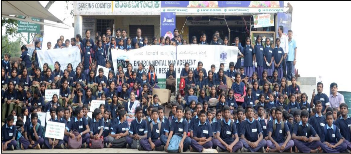
ಪೆನ್ನಾರ್ ನದಿ ತೀರದ ಸ್ವಚ್ಛತಾ ಕಾರ್ಯಕ್ರಮದಲ್ಲಿ ಭಾಗವಹಿಸಿದ ಶಾಲಾ ಮಕ್ಕಳು, ನಂದಿಬೆಟ್ಟ