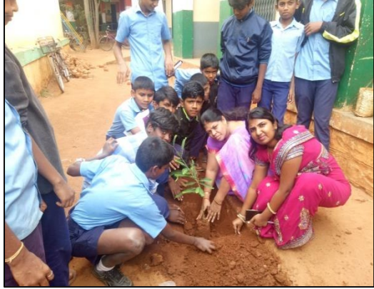
ಇಕೋ-ಕ್ಲಬ್ ಶಾಲೆಗಳಲ್ಲಿ ಪನಿನೀಸಂಸಂ ಸಂಸ್ಥೆಯ ಗಿಡ ನೆಡುವ ಕಾರ್ಯಕ್ರಮ