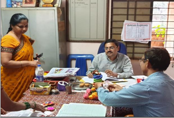
ಸರ್ಕಾರಿ ಘೌಡ ಶಾಲೆ ವಡಗಾವಿ, ಬೆಳಗಾವಿ ಜಿಲ್ಲೆ

ಚಟುವಟಿಕೆಗಳನ್ನು ಪರಿಶೀಲಿಸಲು ಮತ್ತು ರಾಜ್ಯ ಸಂಚಲನಾ ಸಮಿತಿಯಲ್ಲಿ ನಿಗದಿಪಡಿಸಿದಂತೆ ಪನಿನೀಸಂಸಂಯ ರಾಷ್ಟ್ರೀಯ ಹಸಿರು ಪಡೆ ತಂಡವು 40 ಇಕೋ-ಕ್ಲಬ್ ಶಾಲೆಗಳಿಗೆ ಭೇಟಿ ನೀಡಿತು. ಶಾಲೆಗಳಿಗೆ ಭೇಟಿ ಮಾಡಿದ ಅವಧಿಯಲ್ಲಿ ಇಕೋ-ಕ್ಲಬ್ ಚಟುವಟಿಕೆಗಳನ್ನು ಪರಿಶೀಲಿಸಲಾಯಿತು ಮತ್ತು ಶಾಲೆಯ ಮುಖ್ಯೋಪಾಧ್ಯಾಯರೊಡನೆ ಹಾಗೂ ಇಕೋ-ಕ್ಲಬ್ ಉಸ್ತುವಾರಿ ಶಿಕ್ಷಕರೊಡನೆ ಚರ್ಚಿಸಲಾಯಿತು. ಇಕೋ-ಕ್ಲಬ್ ವರದಿ, ಬಳಕೆ ಪ್ರಮಾಣ ಪತ್ರ ಹಾಗೂ ಅಗತ್ಯವಾದ ಮಾಹಿತಿಯನ್ನು ಇಕೋ-ಕ್ಲಬ್ ಉಸ್ತುವಾರಿ ಶಿಕ್ಷಕರಿಗೆ ವಿವರಿಸಲಾಯಿತು. ರಾಷ್ಟ್ರೀಯ ಹಸಿರು ಪಡೆ ತಂಡವು ಭೇಟಿ ನೀಡಿದ ಪ್ರತಿ ಶಾಲೆಯಲ್ಲಿ ಇಕೋ-ಕ್ಲಬ್ ಸದಸ್ಯರನ್ನು ಉದ್ದೇಶಿಸಿ ಮಾತನಾಡಿದರು ಮತ್ತು ಇಕೋ-ಕ್ಲಬ್ ಚಟುವಟಿಕೆಗಳನ್ನು ನಿರ್ವಹಿಸುವಾಗ ಶಿಕ್ಷಕರು ಎದುರಿಸುವಂತಹ ಸಮಸ್ಯೆಗಳನ್ನು ಗಮನಿಸಲಾಯಿತು ಮತ್ತು ಅನುಷ್ಠಾನಗೊಳಿಸಲು ಸುಲಭ ವಿಧಾನಗಳನ್ನು ತಿಳಿಸಿಕೊಡಲಾಯಿತು. ಶಾಲೆಗಳನ್ನು ಭೇಟಿ ನೀಡಿದ ವಿವರಗಳನ್ನು ಅನುಬಂಧದಲ್ಲಿ ನೋಡಬಹುದಾಗಿದೆ.