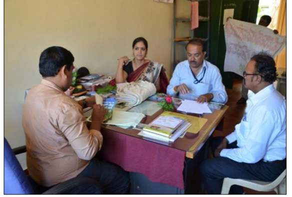
ಸರ್ಕಾರಿ ಘೌಡ ಶಾಲೆ ದೇಶಹಳ್ಳಿ ಮದ್ದೂರು ತಾಲ್ಲೂಕು, ಮಂಡ್ಯ ಜಿಲ್ಲೆ