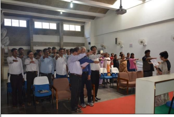
ಪನಿನೀಸಂಸಂಯ ಸಿಬ್ಬಂದಿಯಿಂದ ಹಸಿರು ಪ್ರತಿಜ್ಞೆ