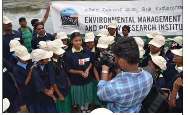
ಕಪಿಲಾ ನದಿ ತೀರದ ಸ್ವಚ್ಛತಾ ಕಾರ್ಯಕ್ರಮದಲ್ಲಿ ವಿದ್ಯಾರ್ಥಿಗಳು ಡಿಡಿ ಚಂದನ ಟಿವಿಗೆ ಸಂದರ್ಶನವನ್ನು ನೀಡುತ್ತಿರುವುದು.