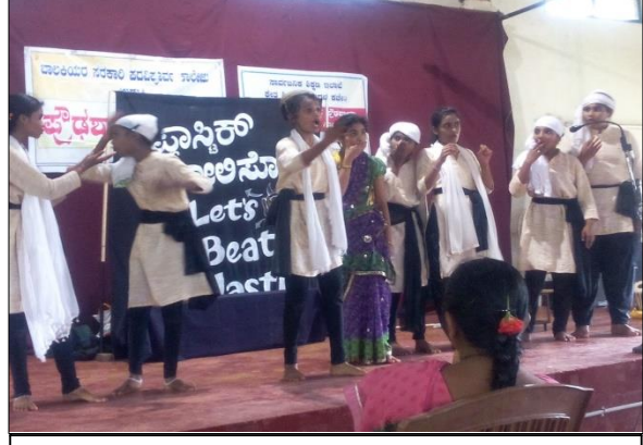
ಸರ್ಕಾರಿ ಬಾಲಕಿಯರ ಪದವಿ ಪೂರ್ವ ಕಾಲೇಜು, ಉಡುಪಿ ಜಿಲ್ಲೆ