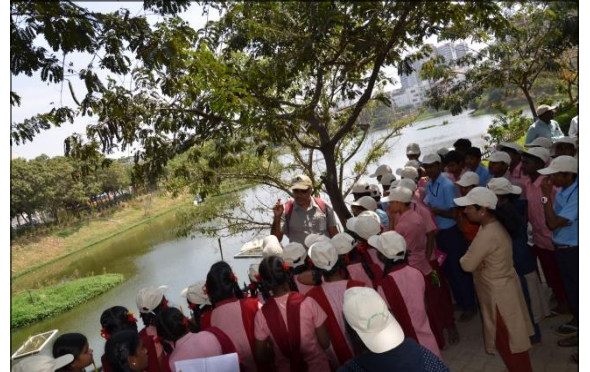
ಪಕ್ಷಿಗಳ ವೀಕ್ಷಣೆ - ವಿದ್ಯಾರ್ಥಿಗಳಿಂದ