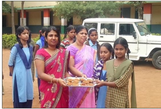
ಇಕೋ-ಕ್ಲಬ್ ಶಾಲೆಗಳಿಗೆ ಮಣ್ಣಿನ ಹಣತೆಗಳ ವಿತರಣೆ