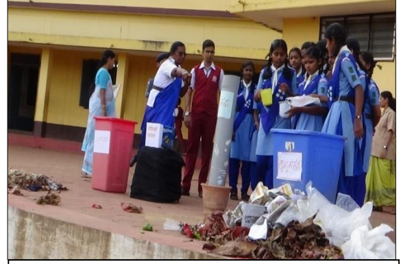
ಮುಕ್ತಿ ಪ್ರಕಾಶ ಪ್ರೌಢ ಶಾಲೆ, ನೀರುಡೆ, ದಕ್ಷಿಣ ಕನ್ನಡ ಜಿಲ್ಲೆ