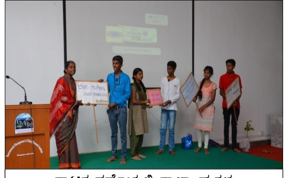
ನಾಟಕ ಸ್ಪರ್ಧೆಯಲ್ಲಿ ಶಾಲಾ ಮಕ್ಕಳು