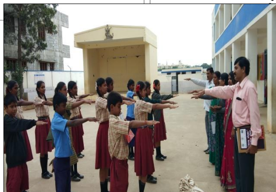
ಇಕೋ-ಕ್ಲಬ್ ಶಾಲೆಗಳ ವಿದ್ಯಾರ್ಥಿಗಳಿಂದ ಜಾಗೃತಿಯ ಪ್ರತಿಜ್ಞೆಯನ್ನು ತೆಗೆದುಕೊಳ್ಳಲಾಯಿತು.