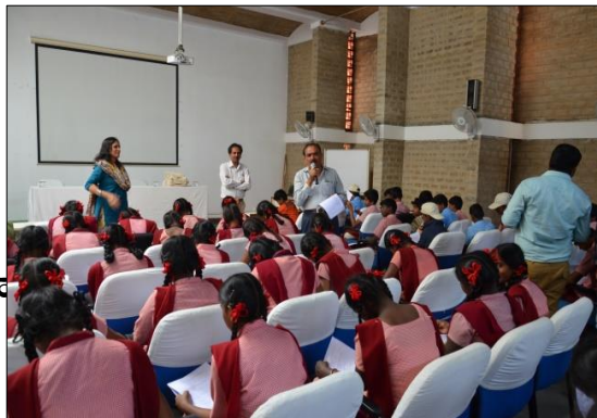
ಶಾಲಾ ಮಕ್ಕಳಿಗಾಗಿ ರಸಪ್ರಶ್ನೆ ಸ್ಪರ್ಧೆ