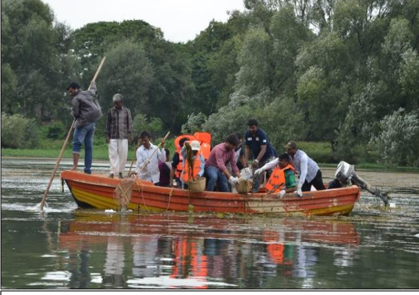
ಕಪಿಲಾ ನದಿಯಲ್ಲಿ ದೋಣಿಯ ಮೂಲಕ ಪ್ಲಾಸ್ಟಿಕ್ ತ್ಯಜ್ಯವನ್ನು ಸಂಗ್ರಹಿಸುತ್ತಿರುವ ದೃಶ್ಯ.